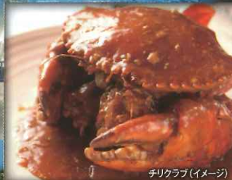
チリクラブ(イメージ)