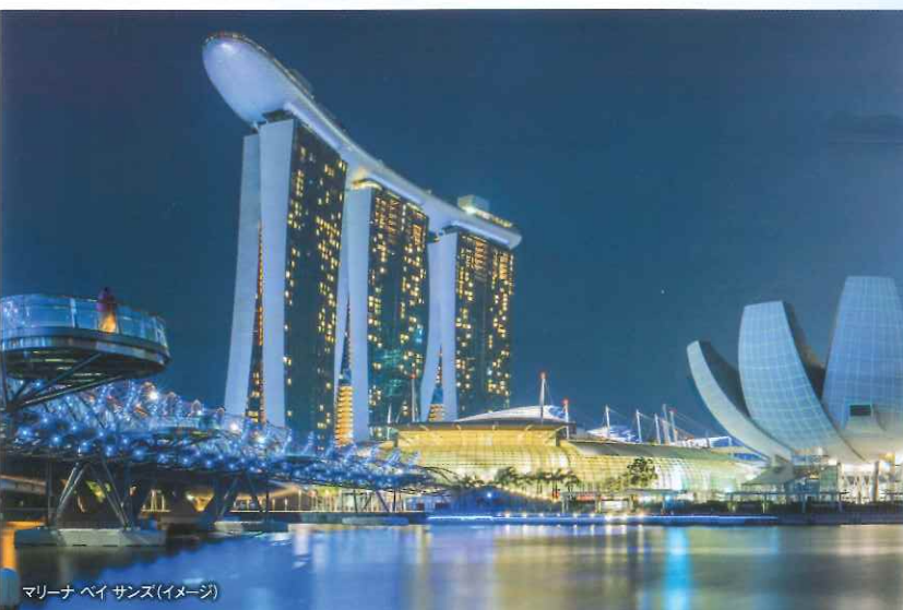
マリーナ・ベイ・サンズ(イメージ)