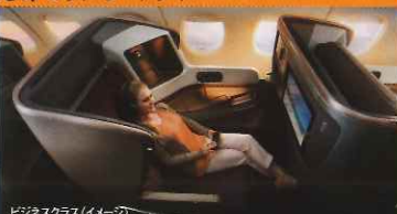
ビジネスクラス(イメージ)

ゆったりとした幅に設計されたシートは座り心地を配慮した革張り。調整可能なフットレストとふらはきまで休めることのできるカーレストも搭載しました。また、よりプライベートな空間をお楽しみ頂くため、大きめのアームレスト、リーディングライト、13.3インチのタッチスクリーンモニターなども装備。お食事は3種類の基本メニューに加え、事前予約制の「プレミアムエコノミーブック・ザ・クック」からもお選びいただけます。