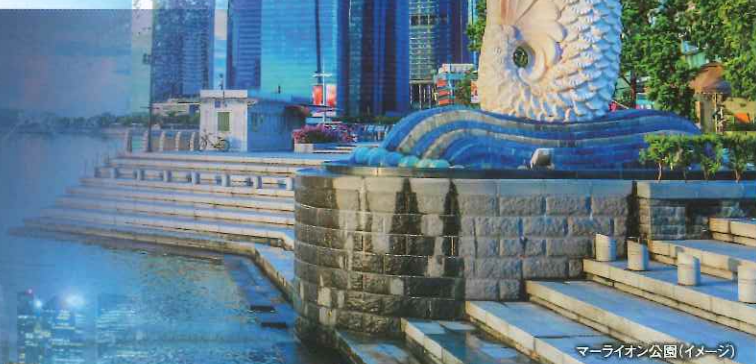
マリーオン公園(イメージ)