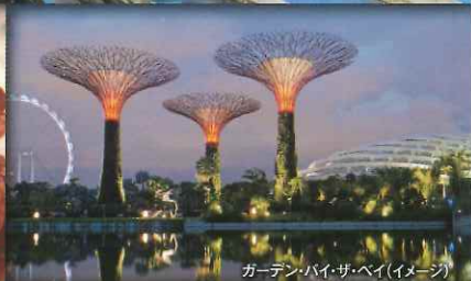
ガーデン・バイ・ザ・ベイ(イメージ)