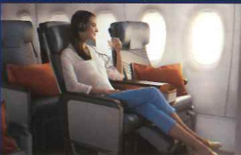
プレミアムエコノミークラス(イメージ)

常に世界各国のメディアで「ベストエアライン」に選ばれるシンガポール航空。日本からはシンガポールへ直行便が毎日就航。シンガポールをベースに、世界36ヶ国101都市の広いネットワークを持ち、アジア人気都市へのフライトが充実しています。また、常に新しい機材を保有することで、世界最高水準の安全性を追求。主要航空会社の中では最も若い部類の平均機齢で、高い定時運航率を誇ります。